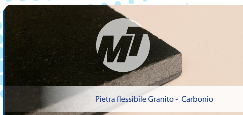
Pietra flessibile Granito - Carbonio