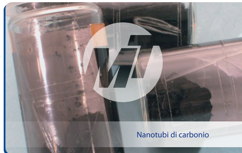
Nanotubi di carbonio