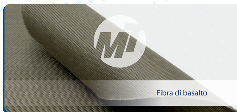
Fibra di basalto