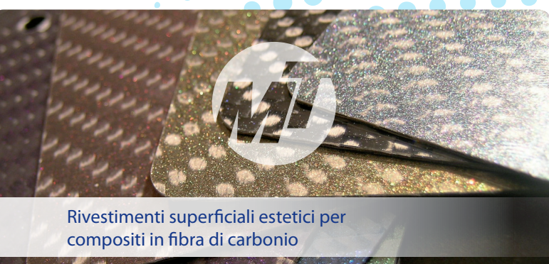
Rivestimenti superficiali estetici per compositi in fibra di carbonio